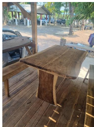
จัดเตรียมที่พักคอย น้ำดื่ม ให้แก่ประชาชน ผู้มาติดต่อราชการ